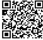
Carte mentale La phrase