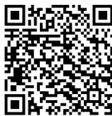
Carte mentale Les accords dans le GN

J'ai repéré les verbes conjugués, cherché leurs sujets , et vérifié les accords sujets verbe.