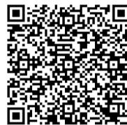
Vidéo : le présent des verbes en -er

J'ai repéré les verbes conjugués, cherché leurs sujets , et vérifié les accords sujets verbe.