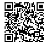
Cartes visuo-sémantiques genre

J'ai vérifié les accords en genre ( masculin , féminin ) dans les GN.